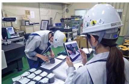
絵コンテを作り込んでからビデオ標準を作成

『標準書を読む、OJTで教えるといった従来の方法では、スピーディで質の高い技能の伝承は容易ではありません。なぜかと言うと、先輩に言われたことを若手が理解できない、つまり聞く側が言葉をイメージ化できないんです。それに比べてビデオ映像なら、