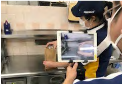
<Photron-Mobile Video Creator>による 動画マニュアル作成風景